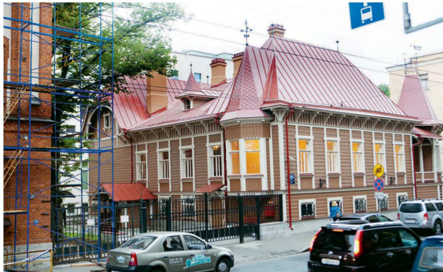
Дом выглядит совершенно неожиданно для каменного Петербурга, и тем больше его ценность.