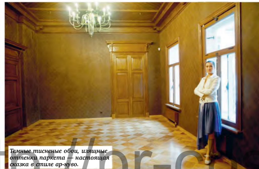
Темные тисненные обои, изящные оттенки паркета — настоящая сказка в стиле ар-нуво.